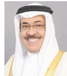
الشيخ خالد بن خليفة آل خليفة

وأعرب رئيس مجلس الأمناء الدكتور الشيخ خالد بن