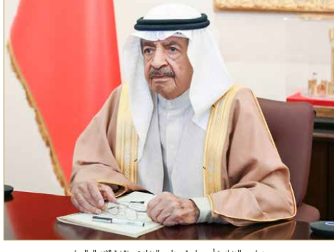
سمو رئيس الوزراء بنحاس جلسة مجلس الوزراء عبر تقنية الاتصال المرئي

المتامة - بنا وجه رئيس الوزراء صاحب السمو الملكي الأمير خليفة بن سلمان آل خليفة إلى التكبير في صرف رواتب موظفي القطاع الحكومي والمتقاعدين قبل حلول عيد الفطر، وكلف سموه وزارة المالية والاقتصاد الوطني بصرف رواتب شهر مايو يوم الخميس الموافق 21 مايو الجاري؛ لتمكين الموظفين والمتقاعدين من تلبية الاحتياجات والالتزامات التي تتطلبها المناسبات. وتابع سموه، في الجلسة الاعتيادية الأسبوعية لمجلس الوزراء التي عقدت عن بُعد عبر تقنية الاتصال المرئي، الإجراءات التي اتخذتها وزارة الإسكان لتنفيذ توجيهات سموه بشأن تلبية الطلبات الإسكانية القديمة لأهالي منطقة عالي، باستيعاب هذه الطلبات ضمن مشروع إسكان الرملي ومنح حصة أكبر من المشروع لأهالي عالي والقرى المجاورة ومرعاة معايير الأقدمية في ذلك.