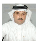
○ غازي المرباطية

التي صدر في ٢٠ أبريل 20١٥، وبالتالي طاب الملاك المؤجرين مسانكهم مساكن مشتركة مخالفون للاشتراطات الموجودة في القرار.