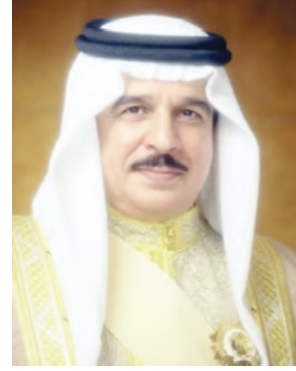
جلالة الملك المفدى

صدر عن حضرة صاحب الجلالة الملك حمد بن عيسى آل خليفة عاهل البلاد المفدى، مرسوم رقم (30) لسنة 2020 بتعيين وكيل في وزارة شؤون مجلس الوزراء جاء فيه: المادة الأولى: يعين سمو الشيخ عيسى بن علي بن خليفة آل خليفة وكيلاً لوزارة شؤون مجلس الوزراء. على وزير شؤون مجلس الوزراء تنفيذ هذا المرسوم، ويعمل به من تاريخ صدوره، وينشر في الجريدة الرسمية.