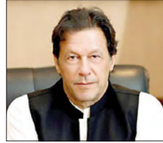
رئيس الوزراء الباكستاني

وجه صاحب السمو الملكي الأمير خليفة بن سلمان آل خليفة رئيس الوزراء خلال ترؤسه جلسة مجلس الوزراء، إلى التفكير في صرف رواتب موظفي القطاع الحكومي والمتقاعدين قبل حلول عيد الفطر. وتابع رئيس الوزراء الإجراءات التي اتخذتها وزارة الإسكان لتنفيذ توجيهات سموه بشأن تلبية الطلبات الإسكانية القديمة لأهالي منطقتي عالي، وذلك باستيعاب هذه الطلبات ضمن مشروع إسكان الرميلى ومنح حصة أكبر من المشروع لأهالي عالي والقرى المجاورة، ومراعاة معايير الأقدمية في ذلك. وأطلع مجلس الوزراء من خلال مذكرة وزيرة الصحة على ما نفّذته وزارة الصحة بالتعاون مع المجلس الأعلى للصحة للتحول إلى الأنظمة الإلكترونية في معاملاتها وخدماتها، وذلك باستخدام الأنظمة والوسائل الإلكترونية عبر تنفيذ النظام الوطني للمعلومات الصحية (I-Seha) الذي عدل ليربط جميع المواقع في الدولة ذات الصلة بمواجهة ومكافحة انتشار فيروس كورونا (كوفيد-19)، بما يتيح المتابعة أولاً بأول للمصابين وغيرهم.