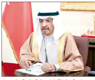
رئيس الوزراء خلال ترؤسه جلسة مجلس الوزراء

وجه صاحب السمو الملكي الأمير خليفة بن سلمان آل خليفة رئيس الوزراء خلال ترؤسه جلسة مجلس الوزراء، إلى التفكير في صرف رواتب موظفي القطاع الحكومي والمتقاعدين قبل حلول عيد الفطر. وتابع رئيس الوزراء الإجراءات التي اتخذتها وزارة الإسكان لتنفيذ توجيهات سموه بشأن تلبية الطلبات الإسكانية القديمة لأهالي منطقتي عالي، وذلك باستيعاب هذه الطلبات ضمن مشروع إسكان الرميلى ومنح حصة أكبر من المشروع لأهالي عالي والقرى المجاورة، ومراعاة معايير الأقدمية في ذلك. وأطلع مجلس الوزراء من خلال مذكرة وزيرة الصحة على ما نفّذته وزارة الصحة بالتعاون مع المجلس الأعلى للصحة للتحول إلى الأنظمة الإلكترونية في معاملاتها وخدماتها، وذلك باستخدام الأنظمة والوسائل الإلكترونية عبر تنفيذ النظام الوطني للمعلومات الصحية (I-Seha) الذي عدل ليربط جميع المواقع في الدولة ذات الصلة بمواجهة ومكافحة انتشار فيروس كورونا (كوفيد-19)، بما يتيح المتابعة أولاً بأول للمصابين وغيرهم.