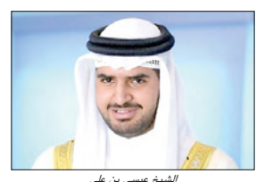
الشيخ عيسى بن علي