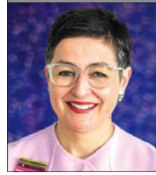
وزيرة خارجية إسبانيا

والجدير بالذكر أن وزارة العدل والشؤون الإسلامية والأوقاف تشارك سنوياً في جائزة الشيخة حصة بنت محمد آل نهيان القرآنية وغيرها من المسابقات، وتقوم بإعداد المتسابقين والتسابقات لهذه المسابقات طيلة العام وفق برنامج إعداد مهاري تشرف عليه إدارة شؤون القرآن الكريم.