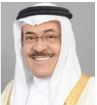
○ الشيخ خالد بن أحمد خليفة

في إطار الإنسانية الحق التي بها وعاشيا بن مجد الوطن، وخضريته لتختون المملكة واحة الأمن والسلام والتعايش والوئام.