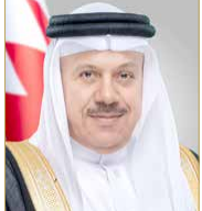
عبدالله بن عبدالعزيز

المنامة - وزارة الخارجية تلقى وزير الخارجية عبد اللطيف بن راشد الزياني، أمس، اتصالاً هاتفياً من وزيرة خارجية مملكة أسبانيا، ماريا غونيو لايا. وجرى خلال الاتصال بحث العلاقات الثنائية المتميزة التي تجمع بين مملكة البحرين ومملكة