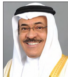
الشيخ خالد بن خليفة آل خليفة

والسعي الدؤوب لنشرها وتجسيدها مشاريع حقيقية تخدم الوطن والعالم، مستلهمين من جلالاته عظيم تاريخ البحرين في حب الآخر المختلف والتعايش معه في إطار الإنسانية الحقة التي بها وعليها بني مجد الوطن، وحضارته لتكون المملكة واحة الأمان والسلام والتعايش والوئام.