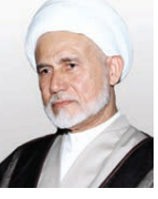
الشيخ عبد الحسين آل عصفور