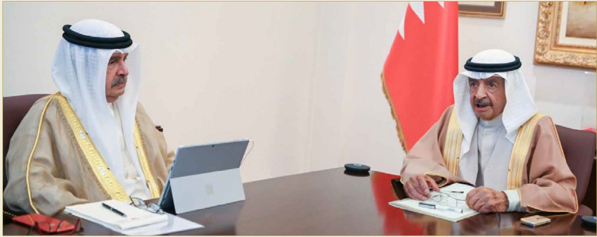
سمو رئيس الوزراء يترأس جلسة مجلس الوزراء عبر تقنية الاتصال المرئي

◆ سمو رئيس الوزراء: تكريس الجهود الحكومية للحفاظ على صحة المواطن والمقيم