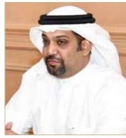
وزير المالية والاقتصاد الوطني

وزير المالية: التحديات تستوجب تضافر الجهود لتقليل من الآثار الاقتصادية