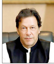
رئيس وزراء جمهورية باكستان

صدر عن حضرة صاحب الجلالة الملك حمد بن عيسى آل خليفة عاهل البلاد المفدى، مرسوم رقم (29) لسنة 2020 بإعادة تنظيم وزارة شؤون مجلس الوزراء جاء فيه: المادة الأولى: يُعاد تنظيم وزارة شؤون مجلس الوزراء، وذلك على النحو الآتي: وزير شؤون مجلس الوزراء، ويتبعه: * وكيل وزارة شؤون مجلس الوزراء. وجاء في المادة الثانية: على وزير شؤون مجلس الوزراء تنفيذ هذا المرسوم، ويُنشر في الجريدة الرسمية.