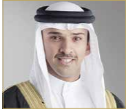
الشيخ علي بن خليفة

والسادد في المهمة الموكلة إليه. وأشاد بالجهود التي يبذلها سمو الشيخ عيسى بن علي بن خليفة في مختلف القطاعات، مجدداً أمنياته بالتوفيق لسموه في خدمة المملكة تحت ظل قيادة جلالة الملك، وترجمة أهداف الرؤية السامية لعاهل البلاد.