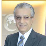
الشيخ سلمان بن إبراهيم

المنامة - بتا بعث محافظ الجنوبية سمو الشيخ خليفة بن علي بن خليفة آل خليفة برقية تهنئة إلى أخيه وكييل وزارة شؤون مجلس الوزراء سمو الشيخ عيسى بن علي بن خليفة آل خليفة، أعرب فيها عن خالص التهانى والتبريكات بمناسبة الثقة الملكية السامية من عاهل البلاد صاحب الجلالة الملك حمد بن عيسى آل خليفة، في إصدار مرسوم رقم (30) لسنة 2020 بتعيين سموه وكيلا في وزارة شؤون مجلس الوزراء.