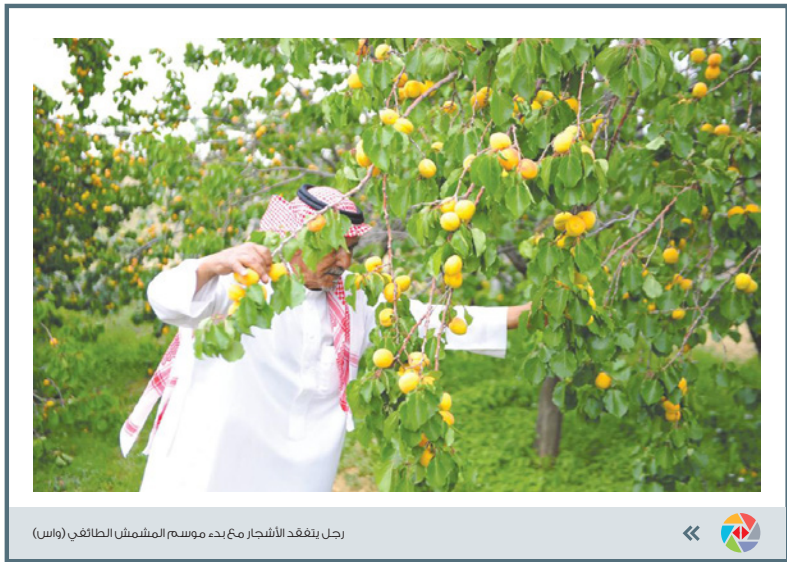
رجل يتفقد الأشجار مع بدء موسم التمشيش الطائفي