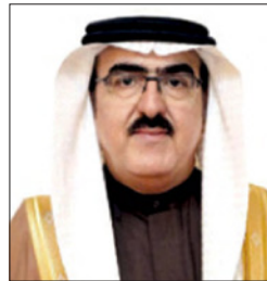
د. ياسر الناصر

من تعاون متمر عظم من الإنجاز الوطني وحفظ الصورة الجميلة للممارسة الديمقراطية البحرينية. من جانب آخر فقد تابع صاحب السمو الملكي رئيس الوزراء الإجراءات التي اتخذتها وزارة الإسكان لتنفيذ توجيهات سموه بشأن تلبية الطلبات الإسكانية القديمة لأهالي منطقة عالي، وذلك باستيعاب هذه الطلبات ضمن مشروع إسكان الرمي ومنح حصة أكبر من المشروع لأهالي عالي والقرى المجاورة ومراعاة معايير الأقدمية في ذلك، وكلف سموه وزارة الإسكان بالإسراع في إيجاد أفضل الحلول لاستيعاب طلبات أهالي منطقة عالي والقرى المجاورة ضمن المشاريع الإسكانية القائمة ومنها مشروع الرمي الإسكاني، بعدها وجه صاحب السمو الملكي رئيس الوزراء إلى التبكير في صرف رواتب موظفي القطاع الحكومي والمتقاعدين قبل حلول عيد الفطر، وكلف سموه وزارة المالية والاقتصاد الوطني بصرف رواتب شهر مايو يوم الخميس الموافق 21 مايو (2020م)؛ لتمكين الموظفين والمتقاعدين من تلبية الاحتياجات والالتزامات التي تتطلبها هذه المناسبة. ويعد ذلك نظر المجلس في المزاكح المدرجة على جدول أعماله، وذلك على النحو التالي: أولاً: وافق مجلس الوزراء على مشروع قرار يحدد الضوابط وإجراءات التصالح في الجرائم المتعلقة بمخالفة أحكام قانون السجل التجاري، ويجيز مشروع القرار للمخالف قبل إحالته للمحاكمة الجنائية أن يطلب من الإدارة المختصة التصالح في المخالفات المنصوص عليها في القانون المذكور أعلاه، ويكون التصالح يسداد مبلغ ألف دينار، ويتحدد المبلغ بتعدد المخالفات