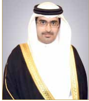
سمو الشيخ خليفة بن علي بن خليفة

كما أعرب سمو الشيخ خليفة بن علي بن خليفة عن خالص اعتزازه بما يقوم به سمو الشيخ عيسى بن علي بن خليفة آل خليفة من أعمال وإنجازات مشرفة للبلاد، سائلاً المولى عز وجل أن يحفظ سموه وأن يوفق لخدمة مملكة البحرين.